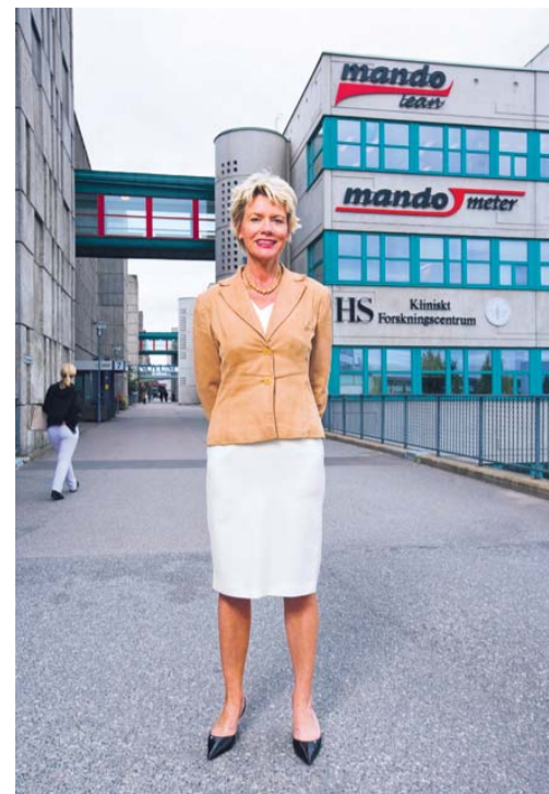
Koncernchef Cecilia Bergh